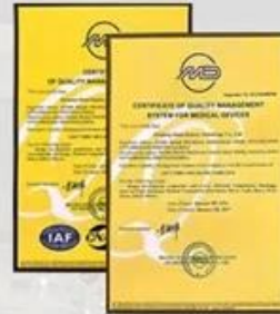
ISO 9001/ISO 13485